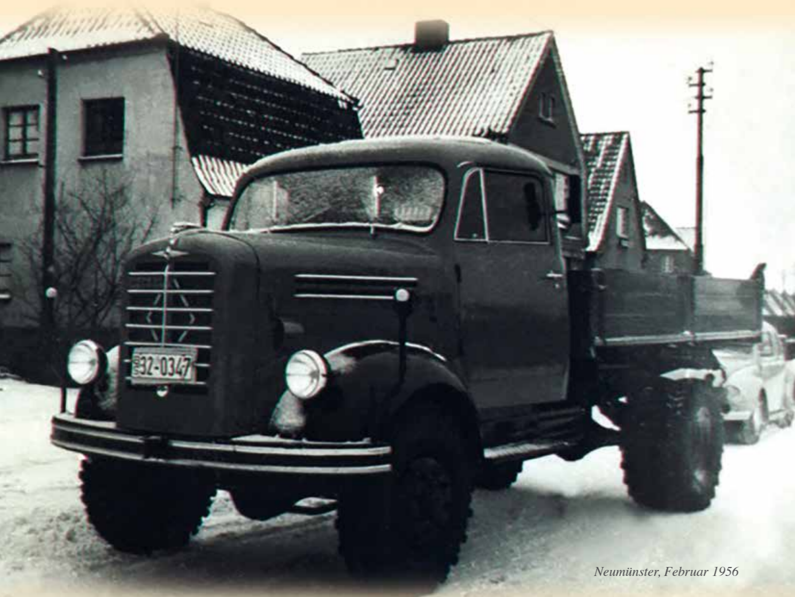
Neumünster, Februar 1956